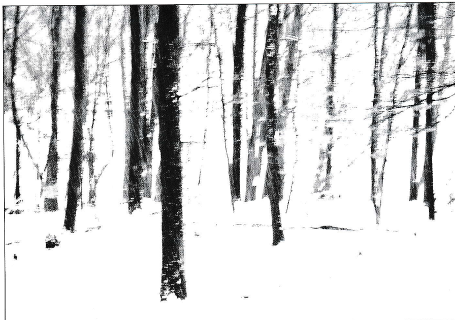
© Monika Behringer, »Winterwald 5«, 2017, (O.i.F)

Linse und Licht und lässt Farben verblassen, Ränder zerfransen, Formen zerfließen und Strukturen verschwimmen. Je durchsichtiger eine Fläche, je zarter ein Strich, desto näher kommt sie der Auflösung. Monika Behringer zeigt uns ihre Sicht auf die Wirklichkeit mit Bildern, die an Malerei und Zeichnung erinnern. Statt Unbehagen vor Auflösung und Leere entdeckt sie deren Schönheit. Die Bilder nehmen Tempo raus. Noch im Erkennen und Abgleichen mit inneren gewohnten Bildern eröffnen sich neue weite Bildräume.