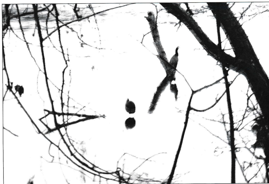
© Monika Behringer, »Das was ist«, 2015, (O.i.F)

Künstlergespräch und Buchvorstellung 20. Juli 2019, 16 Uhr